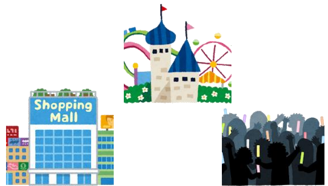
こんざつ 混雑するところにはなるべく い 行かない